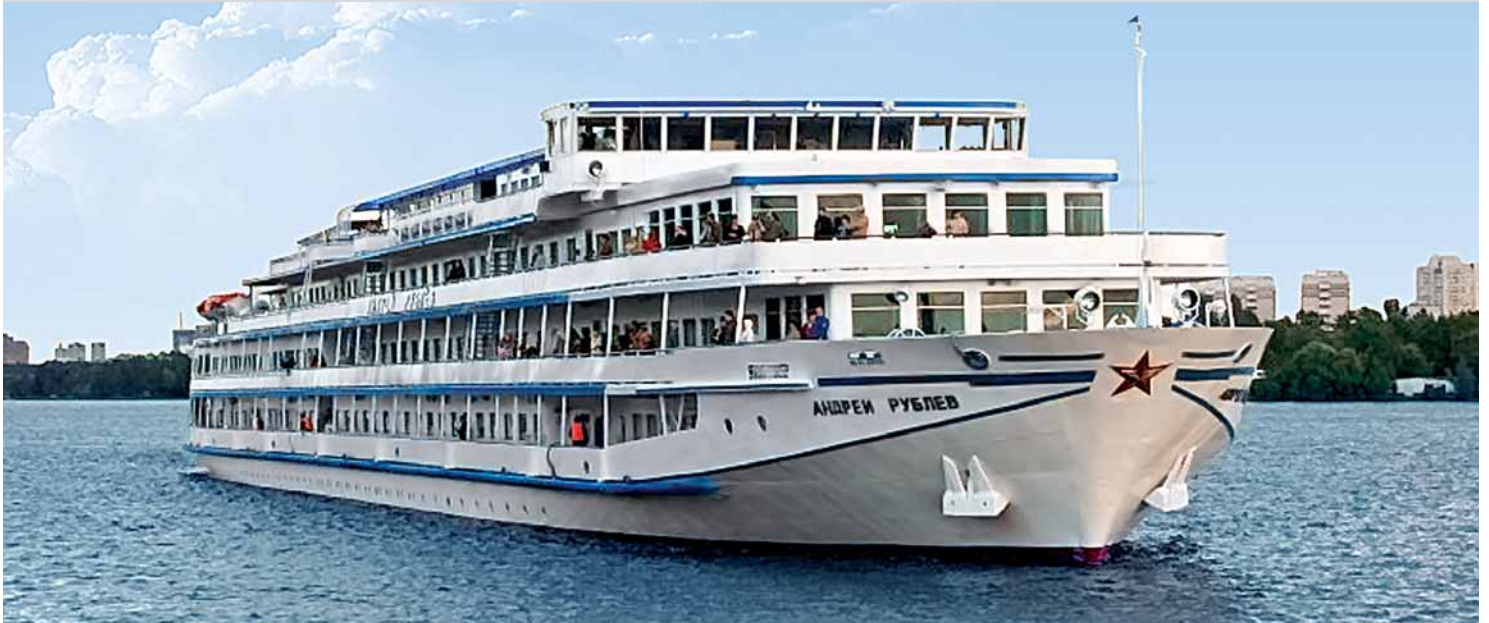
❖ Andrey Rublev

An Bord der Andrey Rublev , die im Winter 2010/11 teilrenoviert wurde, können Sie zwischen zwei Kabinenstandards wählen: Für gehobene Ansprüche stehen Ihnen 20 Deluxe-Kabinen auf dem Ober- und Mitteldeck zur Verfügung. Darüber hinaus finden Sie über alle Decks verteilt einfache Standardkabinen. Sämtliche Kabinen sind außen liegend und mit Dusche/WC, Flachbildschirm-TV, Klimaanlage und Minikühlschrank ausgestattet. Durchweg einladend präsentieren sich die öffentlichen Räumlichkeiten, zu denen zwei Panorama-Restaurants, mehrere Bars und eine Leseecke zählen. Im weitläufigen Außenbereich laden schließlich drei Promenadendecks und ein Sonnendeck zum Verweilen ein.