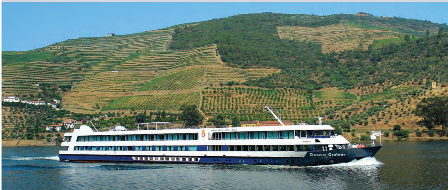
❖ Douro Cruiser

Die 2005 gebauten Schwesterschiffe Douro Cruiser und Douro Queen verbinden hohen Wohnkomfort mit modernster Schiffstechnik und zählen ohne Zweifel zu den besten Schiffen auf dem Douro. Zu Ihrer Wahl stehen ausnahmslos geräumige und sehr ansprechend gestaltete Deluxe-Kabinen, die auf dem Oberdeck sogar über einen eigenen bestuhnten Balkon verfügen. Hier oder auf dem 300 qm umfassenden Sonnendeck mit Swimmingpool genießen Sie die Panoramen der vorbeiziehenden Douro-Tal-Landschaften. Per Lift erreichen Sie bequem alle anderen Bordeinrichtungen – sei es die Lobby mit Rezeption, den Aussichtssalon mit Bar oder das Restaurant, in dem internationale und lokale Spezialitäten serviert werden.